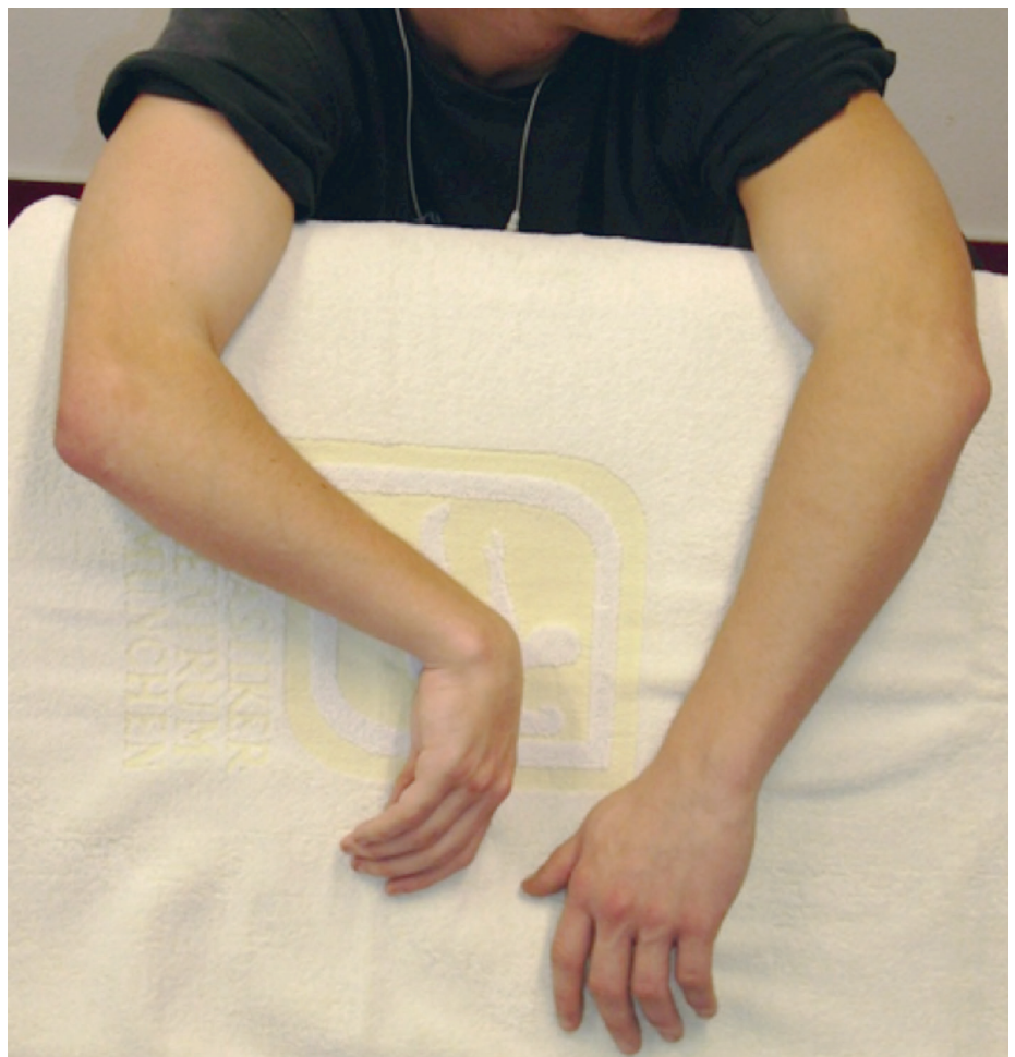
Abb. 2: Patient mit spastischer Hemiparese und Handbeugekontraktur rechts.

Die methodologische Bewertung erfolgte mithilfe der Pedro-Scale [4] und AMSTAR [5]. Der inhaltliche Vergleich der Studien beinhaltete die Kriterien Fallzahl, Einschlusskriterien, Interventionen, Zeit und Intensitäten, Messzeitpunkte und Messmethoden sowie die wichtigsten Ergebnisse.